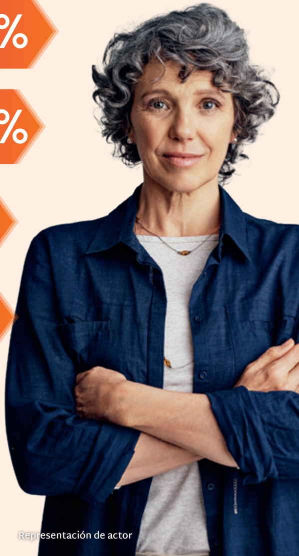
Representación de actor

*En una encuesta, se pidió a 36 cuidadores calificados que notaron movimientos involuntarios anormales en las últimas 4 semanas, y que clasificaran el impacto de cuidar la salud de los pacientes en las vidas de los cuidadores. Las respuestas se basaron en una escala de 0 (ninguno) a 10 (lo peor que se pueda imaginar).